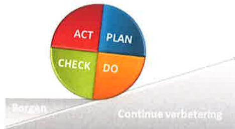
Fig. Cirkel van Deming

Door periodieke beoordeling zal de directie vaststellen of reductiedoelstellingen zijn gerealiseerd. Door het inzetten van de plan-do-check-act methodiek zal worden gestreefd naar het continu verbeteren van ons energiemanagementsysteem.